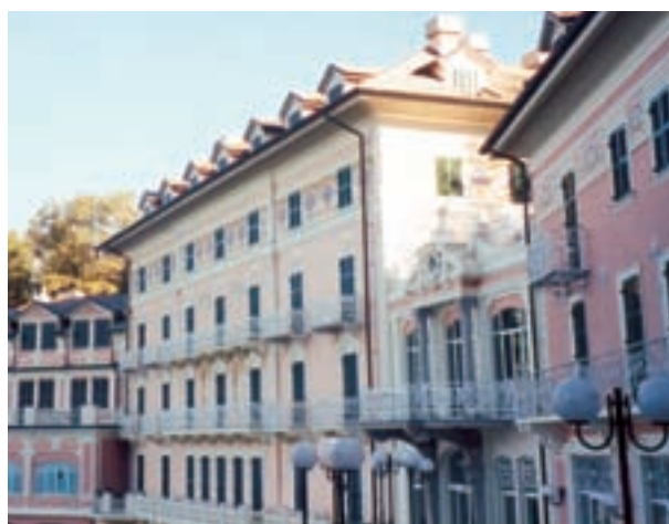
Hotel Vetta - Portofino (GE)