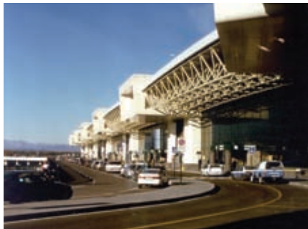
Aeroporto Malpensa - Milano

In tale contesto, la Direttiva 2002/91/CE è entrata in vigore il 4 gennaio 2006. Ciò significa che l'Italia, così come le altre nazioni dell'Unione Europea, ha dovuto adattare le proprie normative nazionali alla nuova Direttiva.