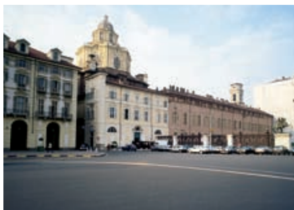
Chiesa di San Lorenzo - Torino